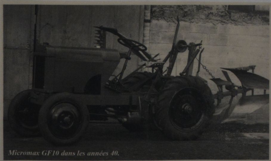
Micromax GF10 dans les années 40.

La fabrication des tracteurs est reprise dans les années 60, principalement de tracteurs vignerons à moteur Alsthom dieselair 2, 3 et 4 cylindres et un moteur essence de 28 cv. A ces engins vient s'ajouter le Motriss 4 Prestige à 4 roues motrice et directrices équipé d'un MWM. En 1969, Valor présente un enjambeur, l'Escalador, dérivé des petit vignerons. La production de tracteur cessera en 1974.