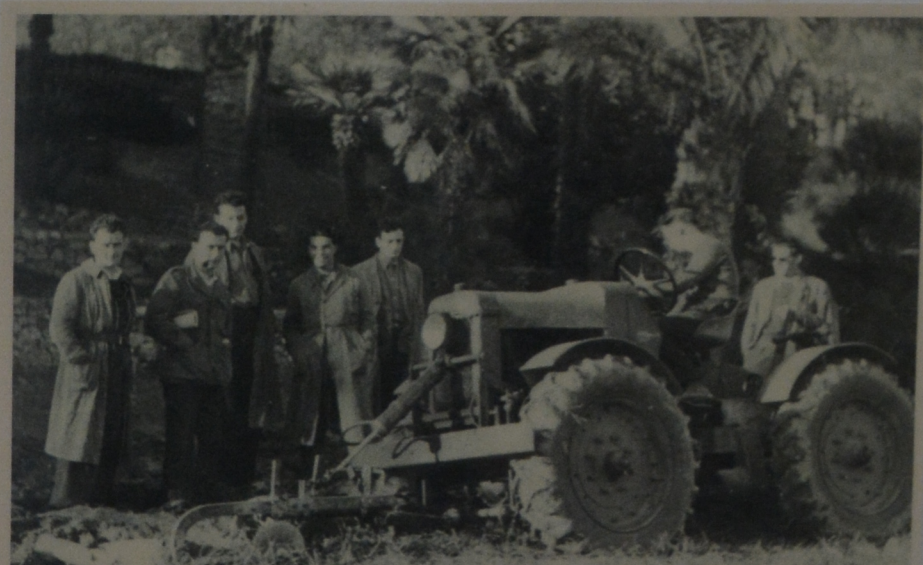
Essai Micromax 4 roues motrices à l'école agricole de Montpellier.

En 1950 fut installé un premier relevage à vérin hydraulique de charrue, en 1955 un nouveau type de relevage avec piston-crémaillère, était créé. En 1956 les Ets Guillemaud Frère ont été vendus et sont devenus les Ets Valor, la production de tracteurs est suspendue.