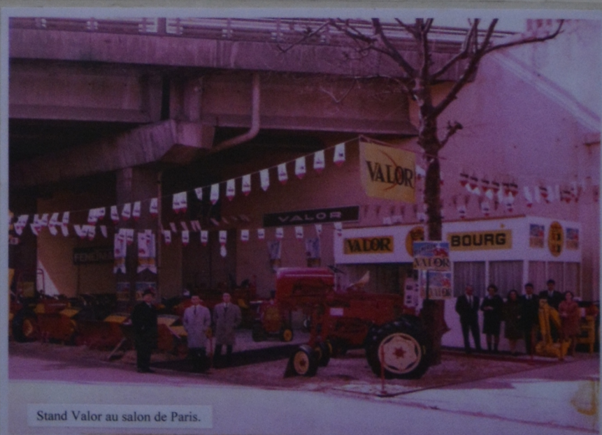
Stand Valor au salon de Paris.