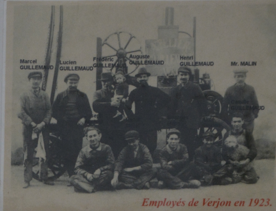
Employés de Verjon en 1923.