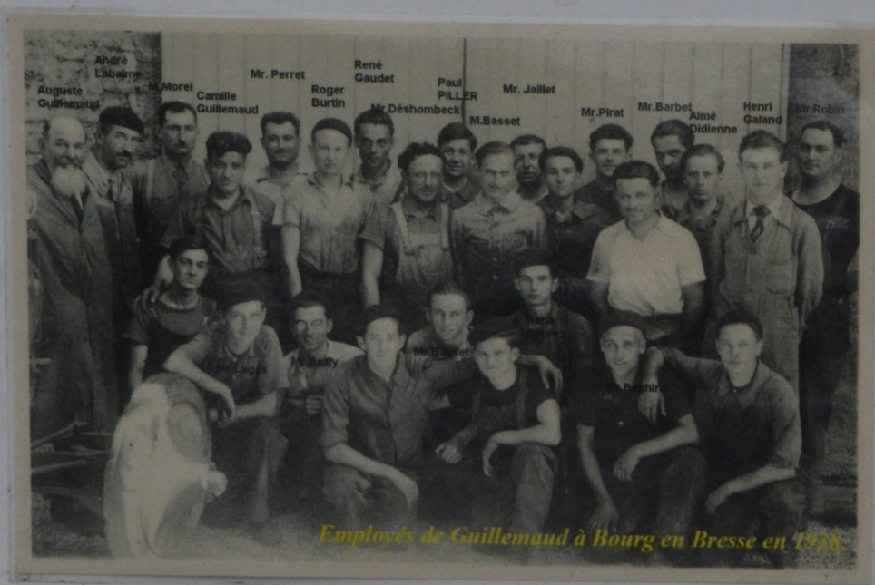
Employés de Guillemaud à Bourges en 1928.

En 1926 Auguste Guillemaud, racheta les machines-outils à ses frères et s'installa dans un bâtiment neuf, Chemin de Montholon à Bourg en Bresse. Il commença par de la sous-traitance de mécanique, puis mise au point des ensacheuses pour cimenterie, des moulins à grains et des engreneurs ( sous-ensemble de machine à battre).