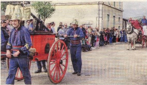
■ Au premier plan, la première pompe à bras de Drom, tirée par les pompiers du Centre de première intervention local.

La fête patronale, animée selon la tradition par l'amicale des sapeurs-pompiers, avait cette année un parfum encore plus coloré avec la commémoration des 150 ans du CPI. Pour l'occasion, la musique des pompiers de l'Ain a assuré l'animation de ce défilé pour lequel les associations locales ont rivalisé de créativité pour