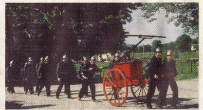
La vieille pompe sera ressortie (photo d'archives).

Pour 2015, les pompiers veulent voir grand. En effet, le CPI (corps de première intervention) fête cette année son 150 e anniversaire. Projeté depuis plusieurs années, l'événement se précise : décidant d'associer ce siècle et demi à la fête patronale, l'amicale a commencé à travailler à son organisation depuis le lendemain de la St-Thyrse 2014.