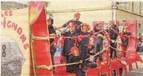
■ Les Dromignons, bien présents avec leur char des « Pompiognons ».

répondre au thème de cette fête patronale. Plusieurs centaines de personnes étaient présentes, ce dimanche, dans les rues du village. 150 années d'histoire étaient retracées dans le défilé avec, notamment, la première pompe à bras de la commune, tirée par les sapeurs-pompiers de la compagnie locale. ■