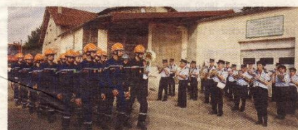
Une importante participation des unités extérieures.

Dans la foulée, les jeunes sapeurs-pompiers présentaient quelques manœuvres, démontrant déjà leurs capacités de rapidité et de précision en matière d'intervention sur un incendie. Enfin, le clou du spectacle permettait de se replonger dans l'ambiance des secours d'antan. En effet, dans les tenues d'un autre siècle, les pompiers de Drom et ceux du musée unissaient leurs efforts et leurs matériels, en faisant appel à la solidarité du public. Une chaîne humaine se mettait alors en place pour apporter de l'eau à la pompe à l'aide de seaux en toile pendant que la grande échelle, dételée, était déployée par six sapeurs. Une fois le tuyau de toile hissé à huit mètres de hauteur, la pompe était actionnée à la force des bras et un jet puissant était rapidement obtenu au bout de la lance sous les applaudissements de la foule.