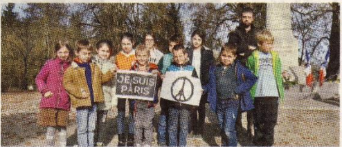
Les écoliers ont tenu à participer.

Suite aux attentats qui ont secoué le pays le 13 novembre, des rassemblements se sont organisés en mémoire et en hommage pour les victimes, mais aussi en réaction devant cette nouvelle forme de guerre qui frappe notre Nation. A Drom, presque un quart de la population s'est retrouvé pour un instant de silence, avec les écoliers et les pompiers. Le matin, explications et échanges ont eu lieu à l'école, sous la direction du maître. Le maire a introduit cette rencontre en rappelant les événements du 13 novembre et les trois jours de deuil, informant que l'état d'urgence était décrété sur tout le pays et en détaillant les mesures prises et les comportements à