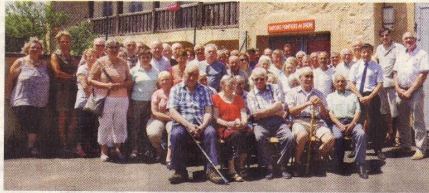
Photo de groupe avant de déguster macédoine et grillades.