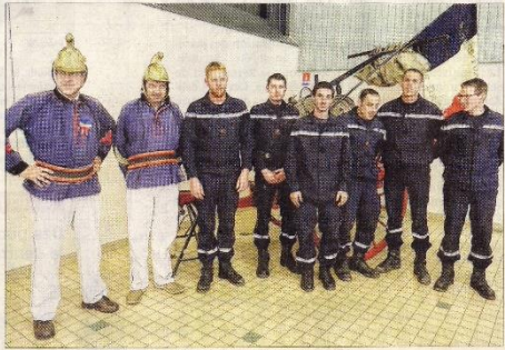
■ L'Amicale des sapeurs pompiers de Drom.