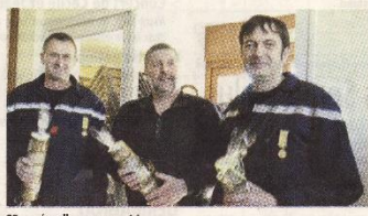
25 années d'engagement !

Avec la fête de Sainte-Barbe, les pompiers de Drom ont clôturé leur 150 e année de présence dans ce petit village revermontois, année marquée par plusieurs événements commémoratifs. Au printemps, les anciens pompiers avaient accueilli leurs collègues rattachés au centre de secours de Treffort pour une journée détente amicale. Le moment fort de cet anniversaire devait ensuite se dérouler pour la saint Thyrse, fête annuelle du village dont les pompiers assurent une bonne partie de l'animation depuis plusieurs décennies.