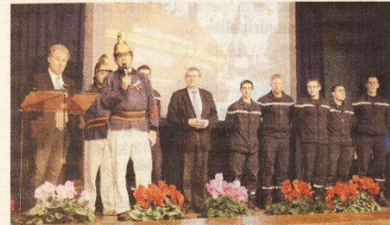
La reconnaissance parlementaire pour 150 ans de présence.