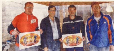
Un siècle et demi, ça se fête !

Relancée par l'amicale des sapeurs-pompiers dans les années 1970-1971, la fête de Drom s'est construite une notoriété dans la vallée, particulièrement pour les tartes des soldats du feu. Une quinzaine d'années plus tard, on voyait s'ajouter un défilé de chars, d'abord pour les enfants, puis pour petits et grands avec la participation des autres associations puis de la commune qui apportèrent d'autres activités pour compléter ces journées, tels les jeux