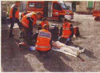
Les premiers soins aux blessés.

Pour leur première manœuvre de rentrée, les pompiers du corps de première intervention (« CPI ») de Drom se sont vus renforcés par leurs collègues du centre de secours (« CS ») du Suran. En effet, deux formations étaient au programme pour tous ces volontaires, avec des simulations pour se préparer à diverses situations, sous l'œil critique des instructeurs. Tout d'abord, chemin des Conches, un feu de broussailles menaçait une habitation qu'il s'agissait de protéger avec ses occupants, tout en recherchant une personne disparue à l'occasion de