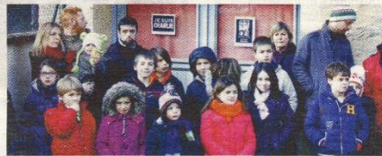
Les écoliers ont tenu à participer

L'attaque terroriste du siège du journal Charlie Hebdo , et l'exécution de son équipe de rédaction, de ses journalistes, rédacteurs, dessinateurs et d'autres membres du personnel, d'agents des forces de l'ordre, ont suscité une vague d'indignation, de tristesse et de colère dans notre démocratie, attachée à ses valeurs et à la liberté d'expression. Partout dans le pays, des rassemblements se sont organisés, en signe de solidarité avec les victimes, de protestation contre de tels agissements,