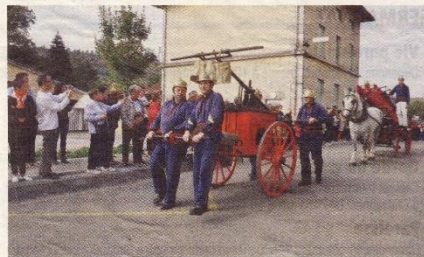
Du matériel flambant neuf.

Depuis bientôt 45 ans, l'amicale des pompiers de Drom assure une animation pour la fête patronale de St Thyrsa, rejointe, depuis, par les autres associations du village, puis par la commune. Souhaitant fêter dignement le 150e anniversaire de la création de la compagnie de sapeurs-pompiers, les volontaires ont alors mis les petits plats dans les grands. Samedi 26 septembre, plus de 730 tartes sont ainsi passées par le four à bois, attirant les gourmands des environs, et, malgré la fraîcheur, la soirée se prolongeait fort tard dans une ambiance surchauffée orchestrée par October, groupe rock revermontois.