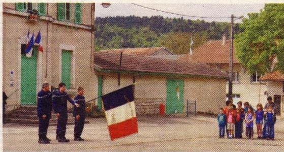
Un moment fort de recueillement.

Pour la commémoration du 8 mai, les écoliers de Drom (Dromignons) ont, une fois de plus, tenu à participer à la cérémonie. Presque tous présents aux côtés du maître d'école, du maire et des pompiers, ils ont présenté une banderole constituée des drapeaux de tous les pays alliés lors du conflit, réalisée par leurs soins après un travail en classe sur ce soixante-dixième anniversaire. Puis, en hommage à toutes les victimes de la déportation, la chanson Nuit et brouillard , interprétée par Jean Ferrat, était diffusée sur la place, provoquant un silence et une émotion intenses chez tous les participants.